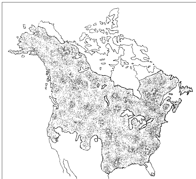
Рис. 1. Распространение норки американской в Северной Америке (Eagle, Whitman, 1987).

ся на глубину до 3 м и даже глубже. Обычны передвижения вдоль берега по суше и воде с продолжительными погружениями в водную среду. В холодный период года умело использует для перемещения подледные пустоты. Рыхлый глубокий снег заметно препятствует ее передвижению. В такой ситуации она редко отходит далеко от берегов, но в бесснежный период может удаляться от водоемов до 1 км. Населяет преимущественно узкие участки территорий вблизи различных ручьев, малых рек, озер, искусственных водоемов с развитой прибрежной древесной и кустарниковой растительностью. Иногда обитает по кромкам болот. Ледостав на мелководьях и высыхание мелких водоемов существенно отражаются на специфике территориального распределения ресурсов вида. В связи с околководным образом жизни распространение хищника в пределах ареала имеет выраженный мозаичный характер.