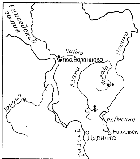
Рис. 1. Схема расположения опорных разрезов верхнего мела Усть-Енисейской впадины.

як). Методами зональной биостратиграфии все разрезы скоррелированы между собой и таким путем составлен свободный разрез верхнего мела Усть-Енисейской впадины (рис. 2).