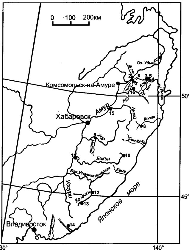
Рис. 1. Схема местонахождений фауны.

Несколько выше предыдущего местонахождения по течению р. Амур, в т. 15 (сборы Б.Я. Черныша, 1962 г., обр. 01303), были найдены Eogaudryceras ( Eotetragonites ) cf. duvalianus d'Orb. (табл. I, фиг. 2) и Inoceramus sp. [4]. Образец, встреченный в бассейне реки Гур, (рис. 1, р. Почепта, т. 16), вместе с Pseudotetragonites cf. kudrjavzevi Druzic [4, 6], скорее всего, является представителем Cleonicer sp. (табл. II, фиг. 16). Несмотря на плохую сохранность данного экземпляра, можно сказать, что он ближе всего к Cleonicer ( Grycia ) sablei Imlay [15] из альба Аляски или к Cleonicer ( Grycia ) dubium (I. Michailova et Terechova), установленному на Северо-Востоке России, в бассейне р. Майн [7]. В работе Е.А. Калинина