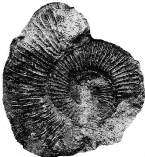
Рис. 3. Oloriziceras schneidi Tavera, 1985; экз. № 376/1, раковина сбоку (×1); Двужкорная бухта; верхний титон.

2/3 боковой стороны ребра раздваиваются на две одинаковые по силе ветви, при этом задняя слабо отклоняется назад, а передняя – чуть вперед. Характер ребристости на вентральной стороне неизвестен. Частота ребристости на наблюдаемых внутреннем и внешнем оборотах не меняется. На раковине при D = 41.0 мм насчитывается примерно 50 внутренних ребер, на сохранившейся части взрослой раковины (несколько меньше половины оборота) – 23 внутренних ребра.